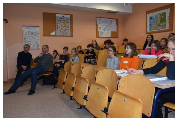
Zbrani na šolskem parlamentu.

V petek, 24. januarja, smo se predstavniki razredov zbrali na šolskem parlamentu, kjer smo imeli predstavitev na temo izobraževanja.