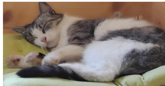
Štirinožna prijateljica Lene iz uredništva #PovejNaprej.

Tudi v tokratni številki #PovejNaprej predstavljamo štirinožnega prijatelja. Tokrat je to muca.