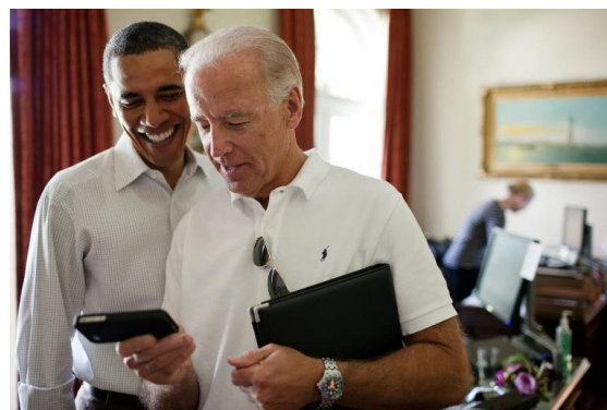
Barack Obama in Joe Biden.

Da bi preživel čim več časa s sinovoma, se je Biden odločil, da bo še naprej živel v Wilmingtonu in se vsak dan vozil z vlakom v Washington, kjer je ohranil ves svoj dolg mandat (1973–2009) v senatu. Biden je prvič kandidiral za predsednika države leta 1987, toda med tisto kampanjo je imel hude glavobole, ki so pripeljali do operacije krvnih strdkov v pljučih.