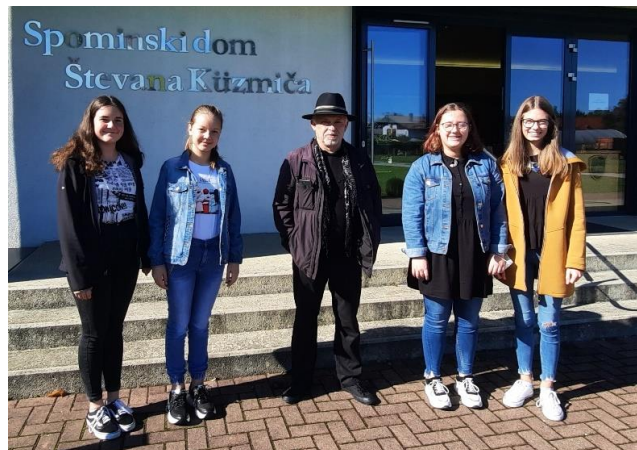
Ja tako je, to je Feri Lainšček.