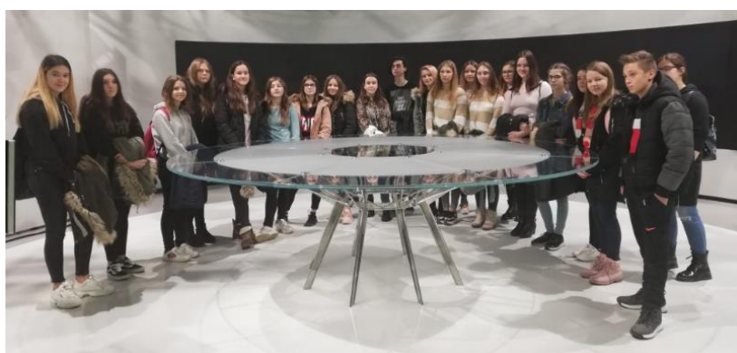
V studiu Odmevov.

V petek, 31. januarja, smo se učenci interesne dejavnosti Šolski časopis in izbirnega predmeta Turistična vzgoja odpravili na ekskurzijo v Ljubljano. Obiskali smo radio in televizijo Slovenija ter sejem Alpe-Adria: Turizem in prosti čas in si ogledali znamenitosti stare Ljubljane.